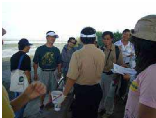
【95.09.30 世界水質監測日活動】 社團活動—綠野仙踪社 萬華社區大學協辦 華江雁鴨公園