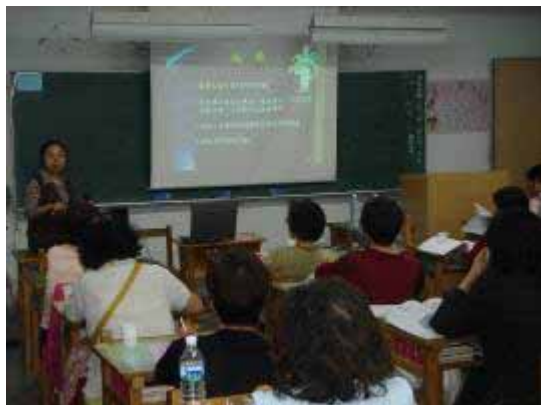
【95.04.21 健康講座】 公民素養週 萬華社區大學主辦 龍山國中