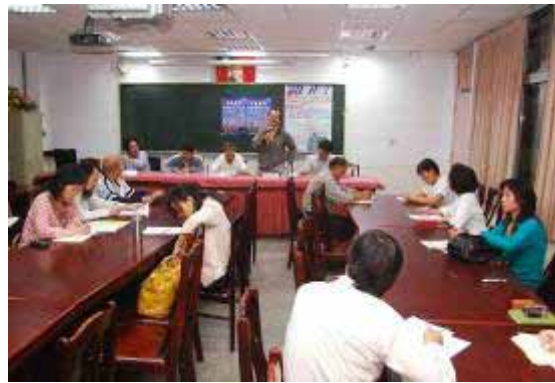
【95.11.01 市民發聲 願景13談】 公民素養週一公共論壇 萬華社區大學協辦 龍山國中三樓會議室