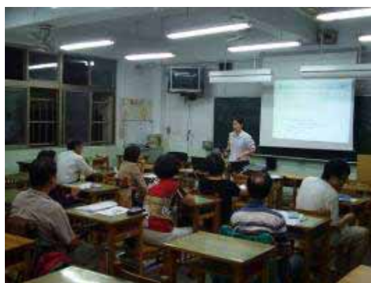
【95.09.04 銀髮族健康保養自己來】 計劃性課程 萬華社區大學主辦 龍山國中