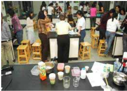
【95.11.01 打皂環保 創意皂形 公民素養週一環保肥皂社 萬華社區大學主辦 龍山國中生物教室