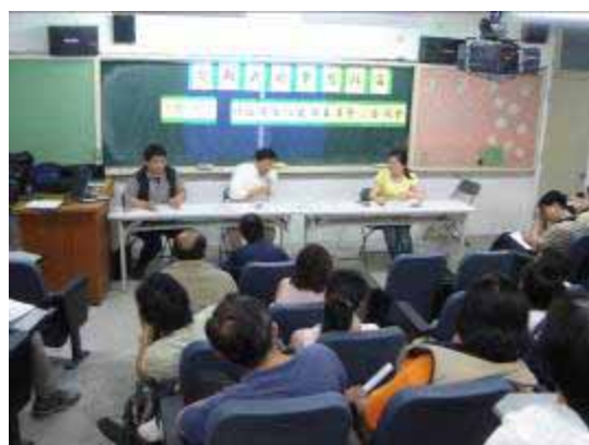
【95.04.12 社區諮詢論壇-勾勒我的夢想社區】 公民素養週 萬華社區大學主辦 龍山國中