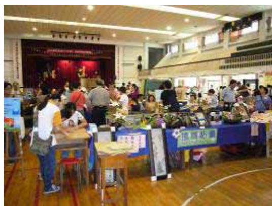
【95.07.01-951 萬國博覽會】 社區參與 萬華社區大學主辦 龍山國中