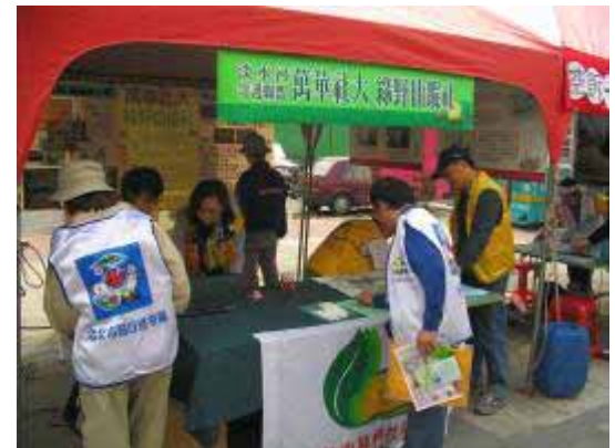
【95.12.03 淡水河慶生會】 綠野仙蹤社 萬華社區大學協辦 大稻埕碼頭第五水門