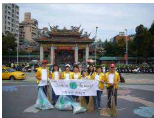
【95.09.23 清潔地球環保台灣】 社區參與、愛心志工社 萬華社區大學協辦 廣州街