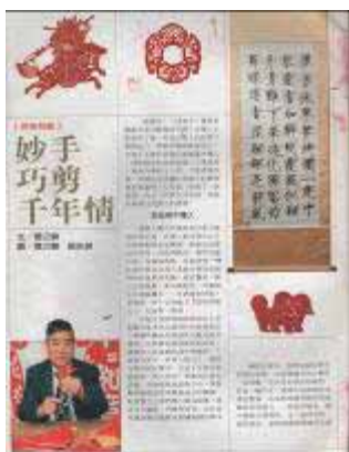
【95.09.04 剪紙藝術創作】 一般性課程 萬華社區大學主辦 龍山國中