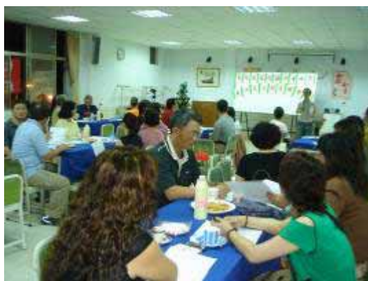
【95.05.01 文化采風節-從艋舺看世界】 公民素養週-美洲文化藝術巡禮 萬華社區大學主辦 龍山國中