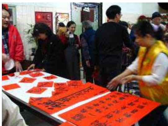
【95.01.10—愛愛院慶生會】 社區參與 萬華社區大學協辦 糖廊里—愛愛院