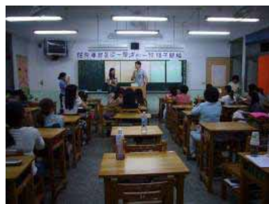
【95.10.11 新移民家庭快樂學中文】 計劃性課程 萬華社區大學主辦 龍山國中