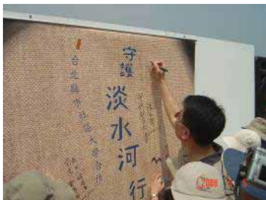
【95.05.05 淡水河朔河行動-守護淡水河】 社區參與 萬華社區大學協辦 淡水河