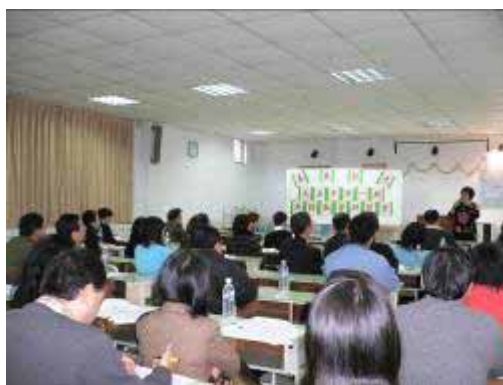
【95.02.28—951 期教師研討會】 於萬華社區大學三樓會議室