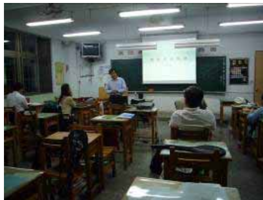
【95.11.09 社區人文生態守護志工】 計劃性課程 萬華社區大學協辦 龍山國中