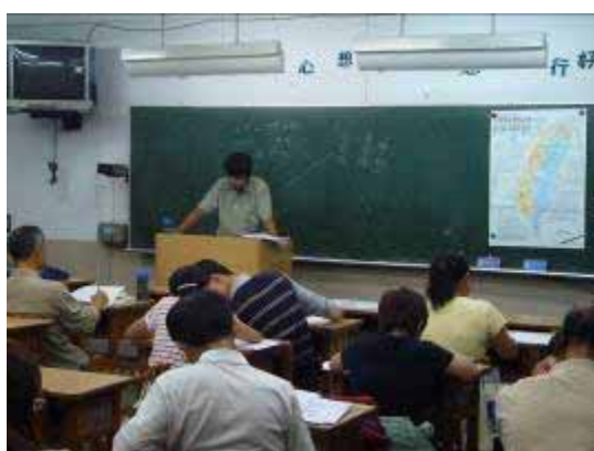
【95.09.04 台灣古道傳奇】 計劃性課程 萬華社區大學主辦 龍山國中