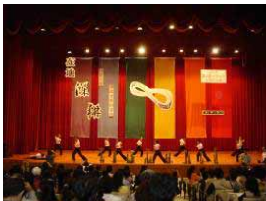
【95.04.28 第八屆全國研討會】 萬華社區大學協辦 屏東大仁科技大學