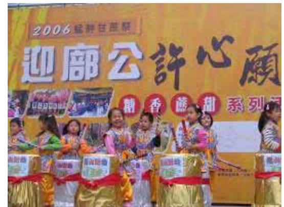
【95.11.05 艋舺甘蔗祭】 社區參與 萬華社區大學協辦 糖廊里