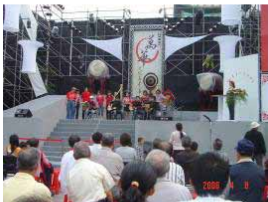
【95.04.08 萬華文化嘉年華】 社區參與—吉它社、排舞社 萬華社區大學協辦 艋舺公園