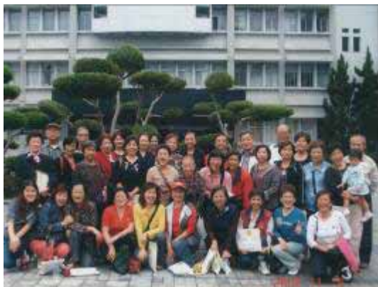
【95.11.03 課程參訪】 社區參與 萬華社區大學協辦 調查局