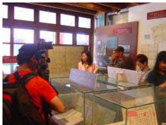
【95.04.04 剝皮寮參訪】 社區參與 萬華社區大學主辦