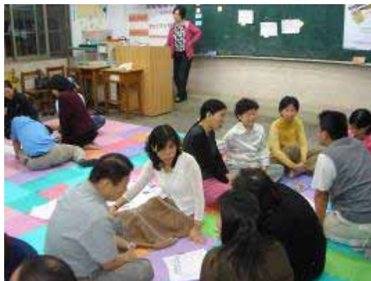
【95.04.24 關機運動-如何發揮公民參與力量,共創優質電視節目座談-公民素養週】 萬華社區大學主辦 龍山國中